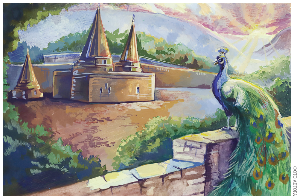
Алма Добарджич. «Святой Лалеш».

Лиц. № Л041-01132-76/00290782 выдана 27.12. 2013 г. Федеральной службой по надзору в сфере здравоохранения, срок действия лицензии – бессрочно